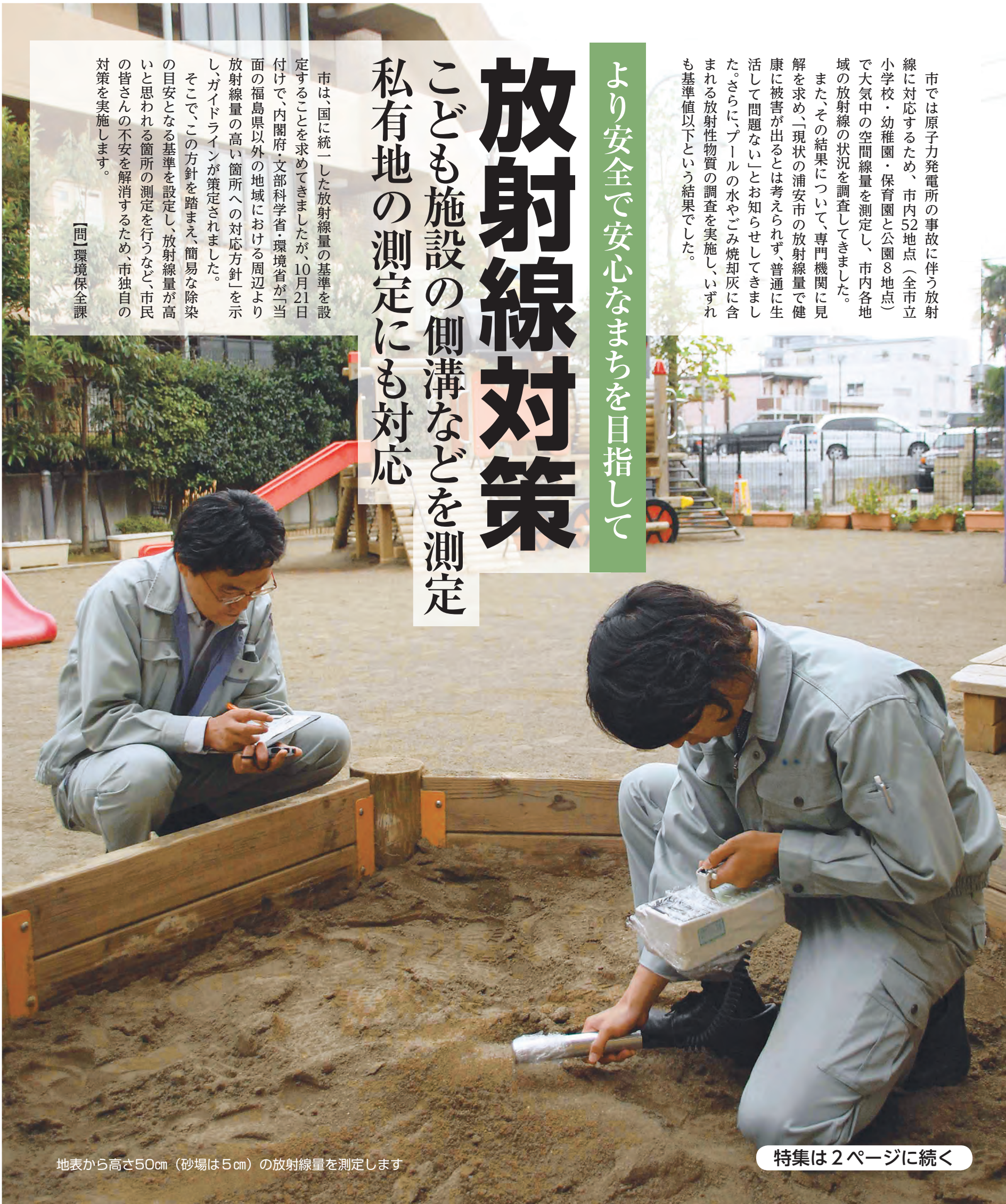
地表から高さ50cm(砂場は5cm)の放射線量を測定します