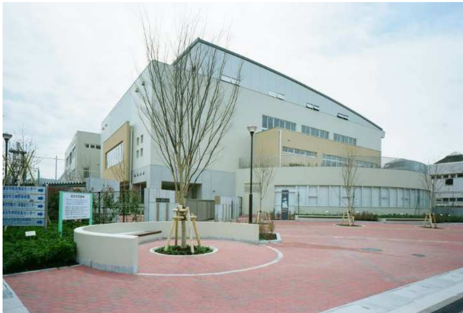
【東野小学校（平成22年4月開校）】