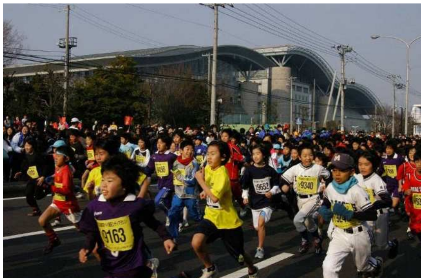
【第 20 回 東京ベイ浦安シティマラソン・小学生 3 km の部】