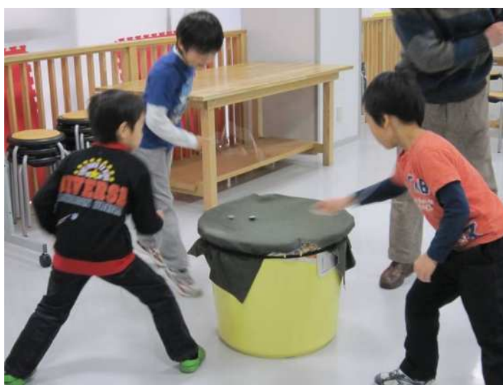
【高洲公民館 高洲ベーゴマ広場】

また、市民の持つ技術や知識を学習資源として蓄積、活用できるような仕組みについて検討します。