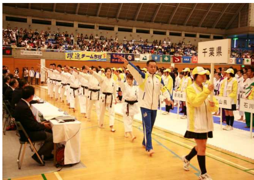
【第65回国民体育大会・ゆめ半島千葉国体2010 空手道競技開始式入場行進 千葉県選手団】