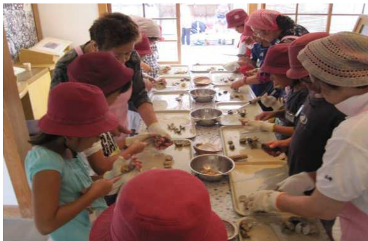
【郷土博物館 昔の生活体験（貝むき体験）】

無形文化財を保存する団体の支援や連携を図りながら、市民が郷土文化に触れられる事業などを行うとともに、後継者の育成や文化の普及に努めます。