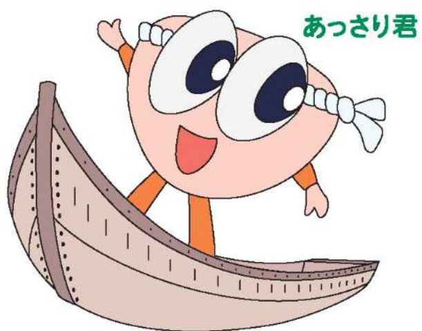
【浦安市郷土博物館キャラクター】