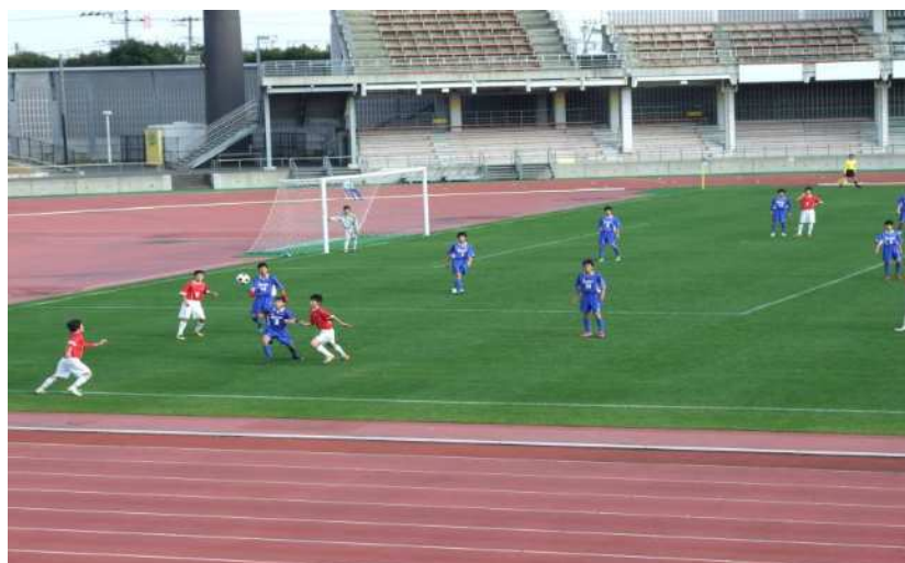
【千葉県中学校新人体育大会サッカー競技決勝 美浜中学校 対 こてはし台中学校】

また、生涯にわたる市民の多様な学習活動を支援するために、中長期的な視野に立った生涯学習施策を総合的、体系的に示す「浦安市生涯学習推進計画」を平成23年度中に策定します。