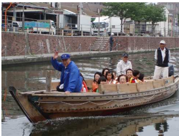
【郷土博物館 境川乗船体験】