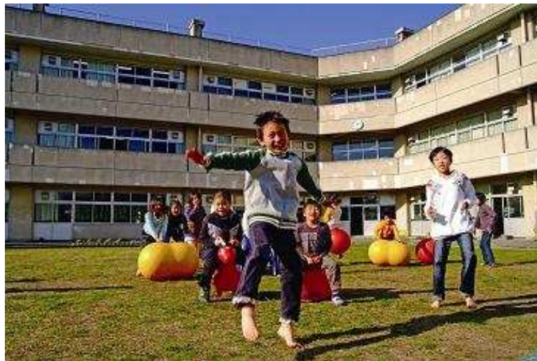
【東小学校 芝生の小校庭】