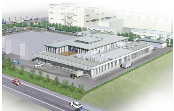
【千鳥学校給食センター第三調理場 鳥瞰図】