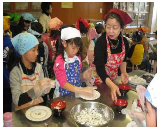
【生涯学習課 学校・地域連携推進事業 みんなで 楽しく学ぶ 土曜教室】