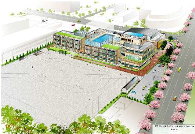
【東野小学校 鳥瞰図】

子どもたちの成長に応じて生じる様々な問題に対応するため、家庭や地域、教育機関や行政が、それぞれの立場から子どもたちとしっかりと向き合い、相互に連携・補完し合いながら、子どもたちの育ちを支えていきます。