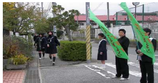
【堀江中学校 あいさつ運動】