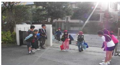
【舞浜小学校 あいさつ運動】

さらには保護者や地域住民にこれらの活動に関する情報を発信しながら、浦安市における教育のオピニオンリーダーとしての役割を担っていきます。各種事業を一体的・効率的に展開していくための新たな教育センターの整備に向けて、検討委員会を設置し、基本構想等を策定します。