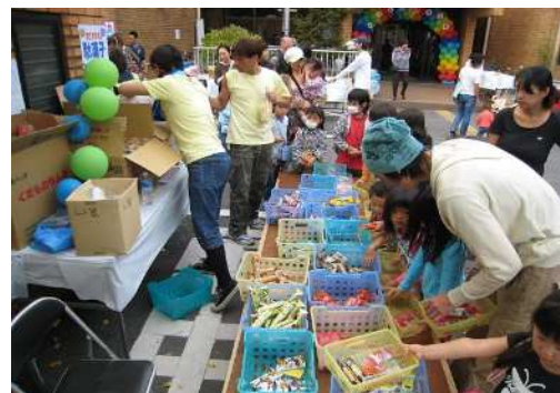
【堀江公民館 文化祭】