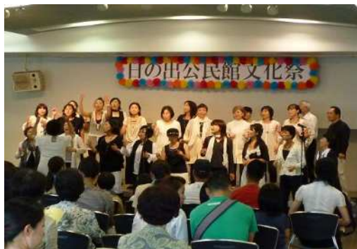
【日の出公民館 文化祭】

また、市民の持つ技術や知識を学習資源として蓄積、活用できるような仕組みを構築します。