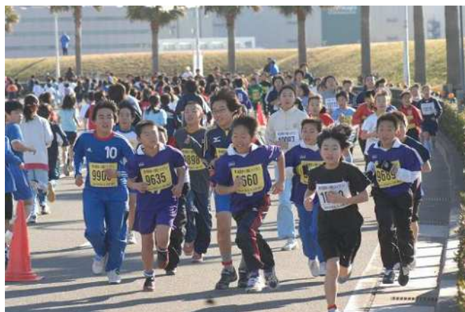
【東京ベイ浦安シティマラソン】