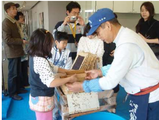
【郷土博物館 海苔すき体験】

無形文化財を保存する団体の支援や連携を図りながら、市民が郷土文化に触れられる事業などを行うとともに、後継者の育成や文化の普及に努めます。