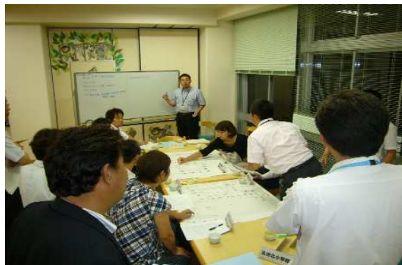
【避難所運営マニュアル作成会議】

また、図書室、音楽室、図工室、多目的室などの特別教室などの開放について検討を進めます。